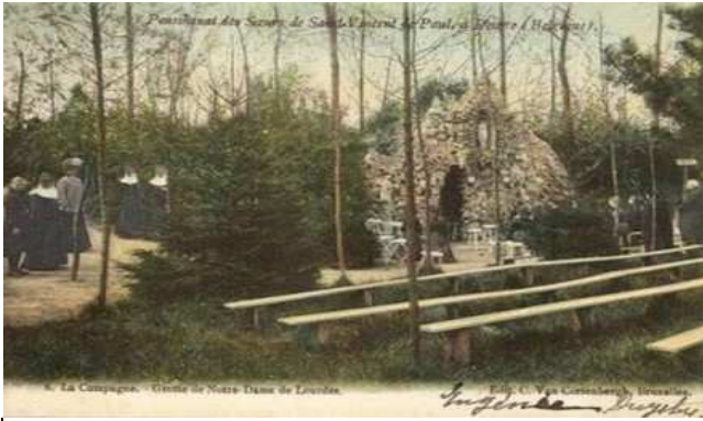
postkaart met afbeelding van de verdwenen 'Bachte grot' houten kapel geplaatst. Het duurde nog tot half augustus 1990 voor er een nieuw hoofdgebouw kon ingezegend worden. Wat later werd de neogotische kruisweg met 14 staties uit 1877, teruggevonden op een zolder van het klooster, hier in ere hersteld. In 1998 kwamen er de 7 staties van Onze-Lieve-Vrouw van Smarten bij.

In 1900 bracht een priester een Mariabeeld mee uit Lourdes voor de zusters St. Vincentius à Paulo van Deinze. In 1902 richtten de zusters de Mariagrot op langsheen het Schipdonkkanaal. Door het geschut van W.O. I werden de bomen totaal verwoest maar bleef de grot miraculeus geheel intact. Decennialang was de plek een vertrouwde en druk bezochte toeverlaat voor bedevaarders. De verbreding van het Schipdonkkanaal, een EEG-richtlijn van 1976, dwong tot een andere inplanting voor deze gebedsplaats. De zusters richtten hier een nieuw Maria-Lourdes-bedevoortoord op. Eind april 1978 werd het Mariabeeld naar de nieuwe site overgebracht en in een voorlopige